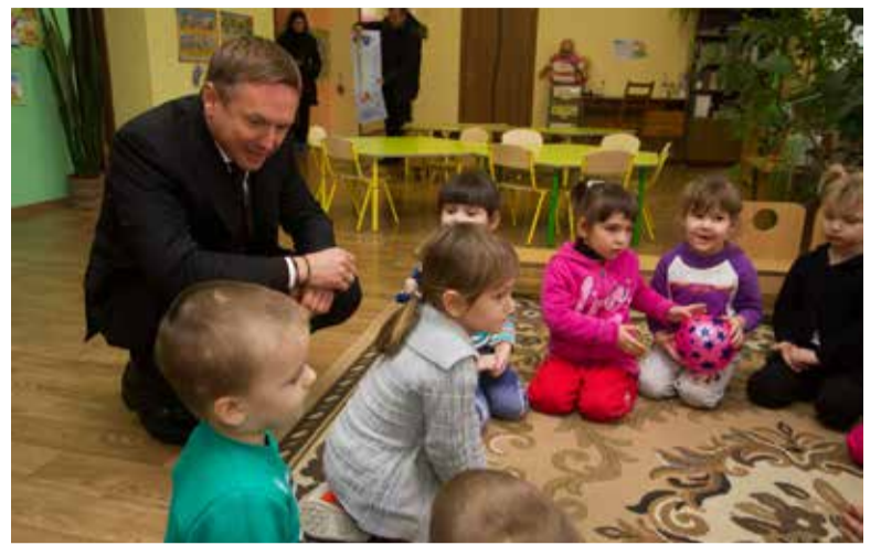
Такого дитсадку як у Великій Білозерці немає і у Києві

У 2017 році я виступив автором та підтримав ряд аграрних законопроектів, які розробляю разом з нашими аграріями. Серед них і Закон щодо продовження мораторію на продаж земель сільськогосподарського призначення до 1 січня 2019 року. Це було однією з головних вимог моїх виборців. Для багатьох мешканців сільської місцевості земля є єдиним джерелом доходу. Безумовно, ринок землі – це необхідна умова подальшого розвитку ринкової економіки, і Україні доведеться пройти весь цей шлях. Але цей ринок повинен бути прозорим і справедливим, конкурентним і ефективним. Потрібно не відривати українців від землі, а навпаки – створювати такі умови, які сприятимуть максимальному розвитку сільського господарства й розвитку села у цілому. Окрім того, депутатська група «Воля народу», до складу якої я входжу, наполягає на запровадженні прозорого оподаткування аграрного сектору, коли податки сплачуються з одного гектара ріллі з урахуванням природно-кліматичних умов та кадастрової оцінки землі.