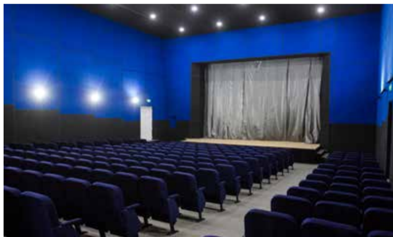
Комишуваський сільський будинок – найкращий у області