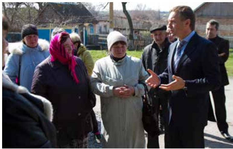
У людей накопичилось дуже багато запитань до влади

Щодо Верховної Ради, ви самі все бачите. Дуже мало конструктиву. Все більше політики та демагогії. У такій ситуації працювати дуже непросто. У 2017 році мною було розроблено і внесено на розгляд парламентських комітетів 11 законопроектів. Більшість документів вже пройшли узгодження з міністерствами, комітетами, урядом, експертами, отримано їхні позитивні висновки. В результаті, документи вже внесені на розгляд Верховної Ради, їх навіть ставлять на порядок денний. Але через постійний зрив роботи, затягування часу, дійсно важливі законопроекти залишаються нерозглянутими. Над якимось призначенням чиновника Верховна Рада може сидіти майже добу, а на важливі речі часу не вистачає. На жаль, все частіше парламент займається незрозумілими політичними іграми, а депутати використовують трибуну Ради для свого піару. Тому й така низька довіра людей до Верховної Ради.