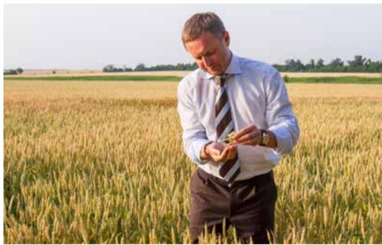
Немає більш шанованої праці, ніж праця на землі