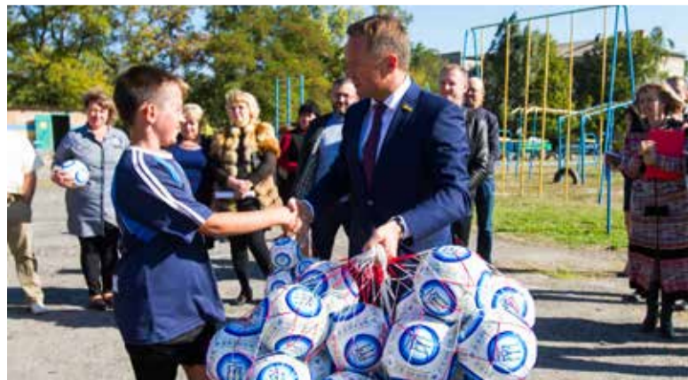
Передача м'ячів, та фото з командою переможницею турніру

– В першу чергу, терпіння та віри в краще. З цими якостями ми зможемо досягти будь-якої мети. А ще бажаю кожній сім'ї миру. Ми, як ніхто, це заслужили та сплатили велику ціну. Матерям та всім жінкам бажаю любові, нашим ветеранам – здоров'я та визнання їхнього великого подвигу. Молоді бажаю без остраху йти вперед і бути в рази мудрішими та успішнішими своїх батьків, бо саме в їхніх руках майбутнє нашої країни. А ще побажаю всім без винятку натхнення. Нам треба зробити ще дуже багато, бо ми ніколи не зупиняємося на досягнутому.