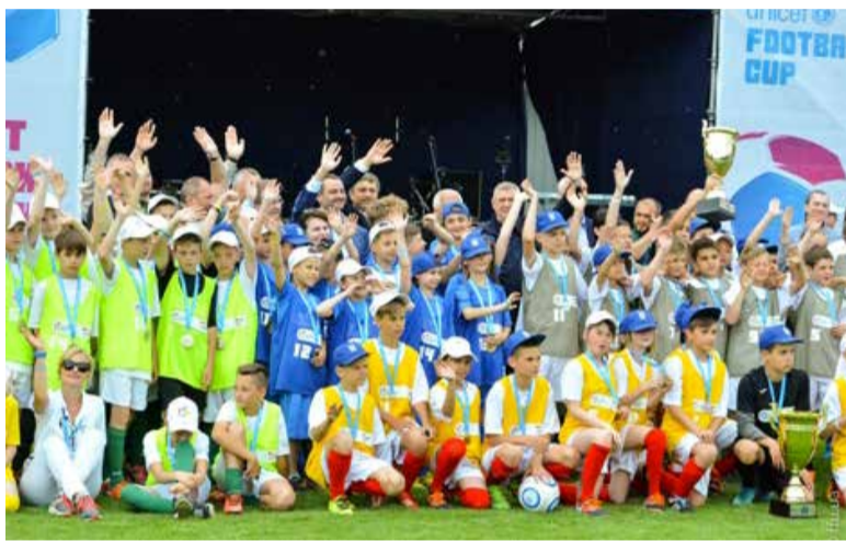
Команда юних футболістів з Енергодару виграла Кубок UNICEF football Cup