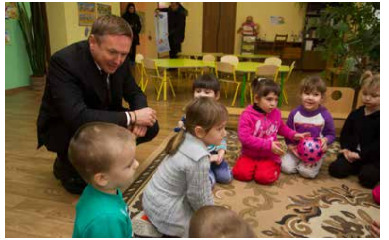
Такого дитсадку як у Великій Білозерці немає і у Києві

У 2017 році я виступив автором та підтримав ряд аграрних законопроектів, які розробляю разом з нашими аграріями. Серед них і Закон щодо продовження мораторію на продаж земель сільськогосподарського призначення до 1 січня 2019 року. Це було однією з головних вимог моїх виборців. Для багатьох мешканців сільської місцевості земля є єдиним джерелом доходу. Безумовно, ринок землі – це необхідна умова подальшого розвитку ринкової економіки, і Україні доведеться пройти весь цей шлях. Але цей ринок повинен бути прозорим і справедливим, конкурентним і ефективним. Потрібно не відривати українців від землі, а навпаки – створювати такі умови, які сприятимуть максимальному розвитку сільського господарства й розвитку села у цілому. Окрім того, депутатська група «Воля народу», до складу якої я входжу, наполягає на запровадженні прозорого оподаткування аграрного сектору, коли податки сплачуються з одного гектара ріллі з урахуванням природно-кліматичних умов та кадастрової оцінки землі.