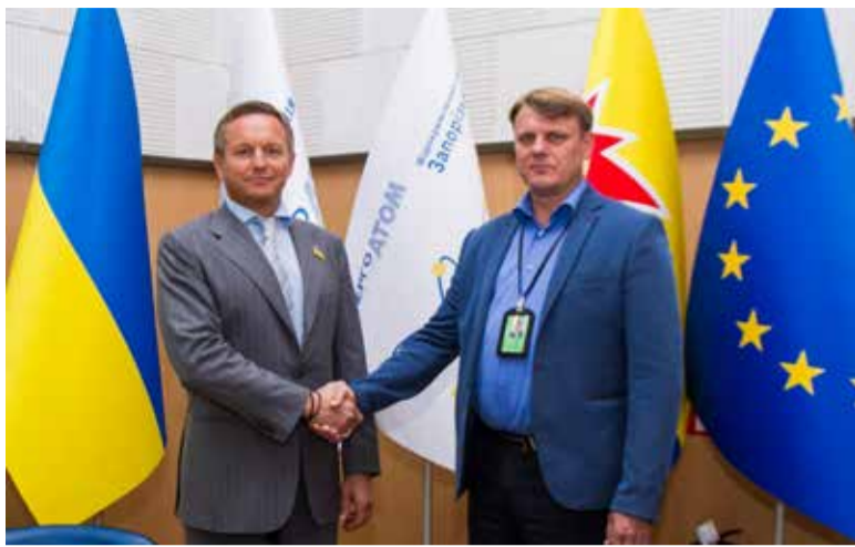
Разом з директором Запорізької атомної станції Олександром Остаповцем

У 2017 році були створені Великобілозерська, Кам'янсько-Дніпровська, Водянська, Оріхівська, Благовіщенська, Підгірненська громади. Упевнений, що й у них все вийде. Як народний депутат, я і надалі відстоюватиму інтереси громад, допомагатиму людям об'єднуватися для проведення таких необхідних змін.