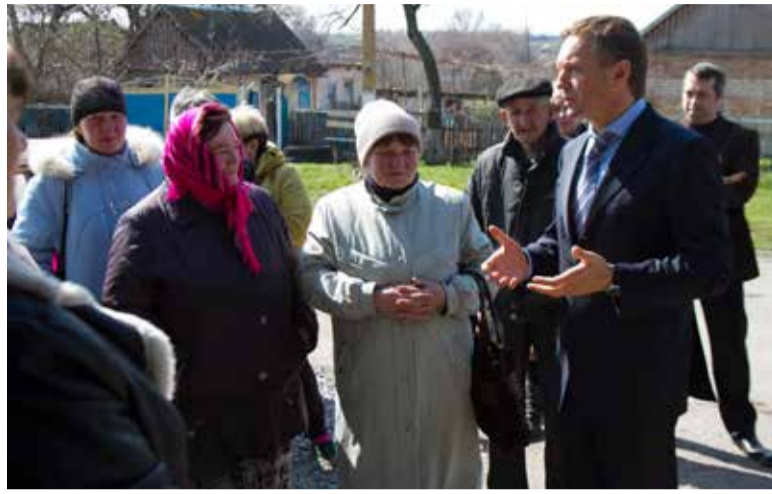
У людей накопичилось дуже багато запитань до влади

Щодо Верховної Ради, ви самі все бачите. Дуже мало конструктиву. Все більше політики та демагогії. У такій ситуації працювати дуже непросто. У 2017 році мною було розроблено і внесено на розгляд парламентських комітетів 11 законопроектів. Більшість документів вже пройшли узгодження з міністерствами, комітетами, урядом, експертами, отримано їхні позитивні висновки. В результаті, документи вже внесені на розгляд Верховної Ради, їх навіть ставлять на порядок денний. Але через постійний зрив роботи, затягування часу, дійсно важливі законопроекти залишаються нерозглянутими. Над якимось призначенням чиновника Верховна Рада може сидіти майже добу, а на важливі речі часу не вистачає. На жаль, все частіше парламент займається незрозумілими політичними іграми, а депутати використовують трибуну Ради для свого піару. Тому й така низька довіра людей до Верховної Ради.