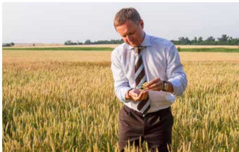
Немає більш шанованої праці, ніж праця на землі